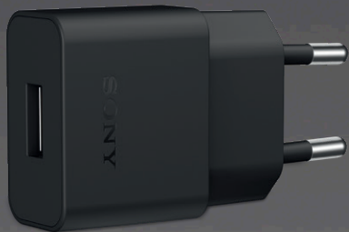
USB C-Ladegerät | UCH20C